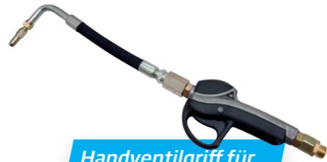
Handventilgriff für Öl/Frostschutz