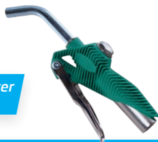
Dosierpistolen für unterschiedliche Schmierstoffe

Bestellen Sie noch heute bei Ihrem Händler!